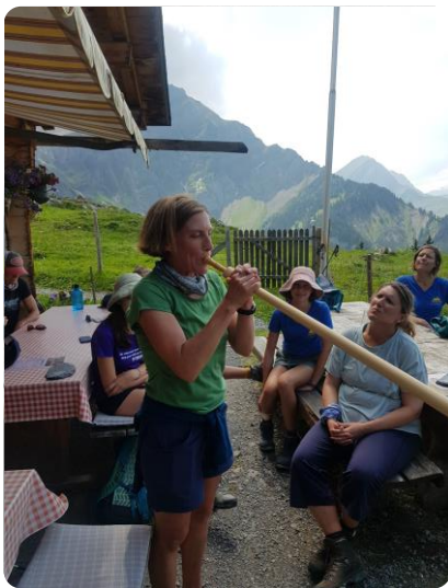
Alphornkurs auf der Bonderalp